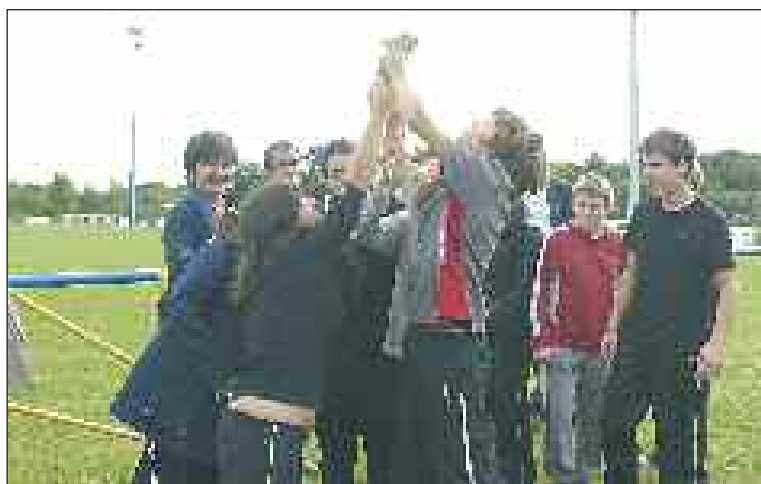
La joie de remporter une coupe !