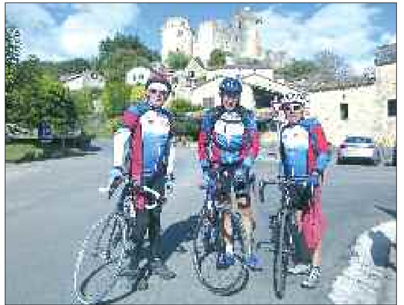
Les Sarladais devant le château de Bonaguil

La seconde étape du dimanche, également de 130 km environ, commence par une visite pédestre et guidée de la vieille ville de Sarlat. Les trois locaux rejoignent le groupe en cours de route. De multiples côtes émaillent toujours le parcours et les sites touristiques se succè-