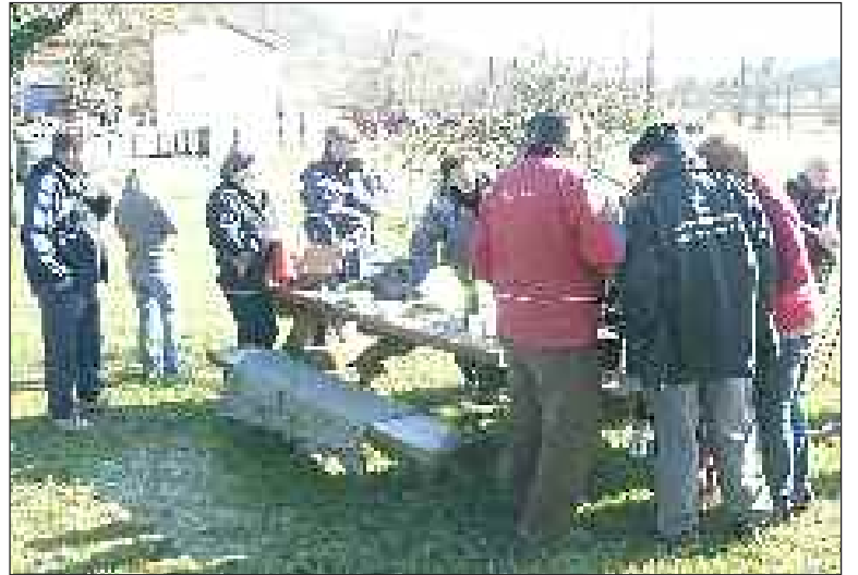
L'édition 2009, première du genre, a séduit un large public

Soutenu par plus de cent bénévoles, l'Office de tourisme cantonal organise la II e édition de la Ronde des villages, une randonnée originale entre terroir et culture, les 16 et 17 octobre.