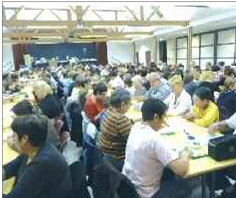
Une salle comble pour le quine

Belle réussite de la friperie et du loto.