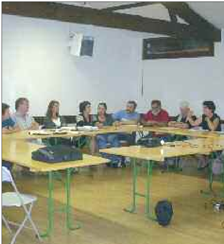
Les élus au travail