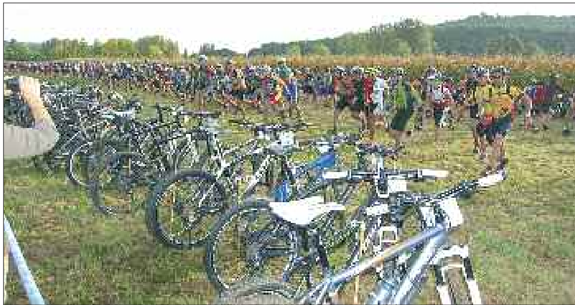
La prise en selle des VTT

Dimanche 3 octobre, sous le soleil de Saint-Léon-sur-Vézère, plus de 1 700 personnes participaient à la Rando Silex. Organisée depuis dix ans par le club de VTT local Le Vélo Silex, elle a rassemblé plus de 1 300 vélos et 400 randonneurs sur les sentiers de la vallée de la Vézère, confirmant ainsi son statut d'événement sportif majeur dans le département. C'est aussi une excellente publicité pour le Périgord, plus de la moitié des concurrents venaient de l'extérieur.