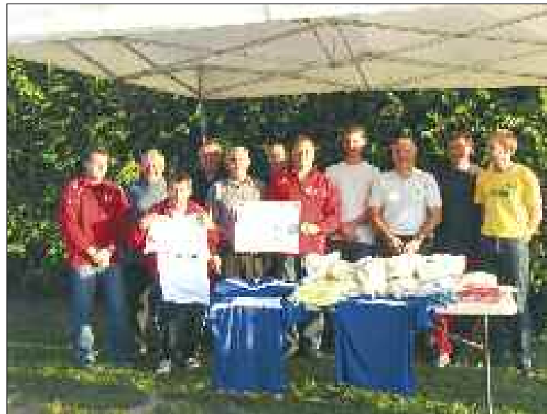
Lors de la remise des maillots

Samedi 2 octobre, l'US Meyrals organisait la journée d'accueil des U9 sur son terrain. Deux cents footballeurs en herbe s'en sont donné à cœur joie avant de prendre un goûter bien mérité. Ils ont évolué en lever de rideau de leurs aînés les U13 qui affrontaient le FC belvésois, une équipe renforcée par le prêt de deux Meyralais. Les locaux s'imposent 4 à 2.