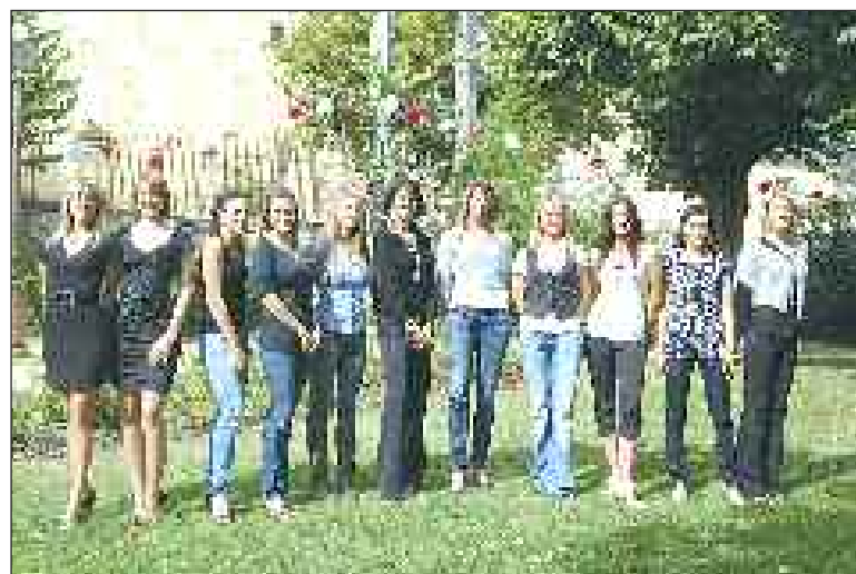
Les prétendantes au titre