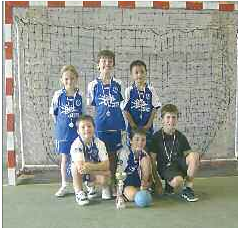
Les moins de 9 ans, fiers de leur coupe et de leurs médailles

Dimanche 3 octobre, les moins de 9 ans de l'ASM handball Sarlat disputaient leur premier tournoi.