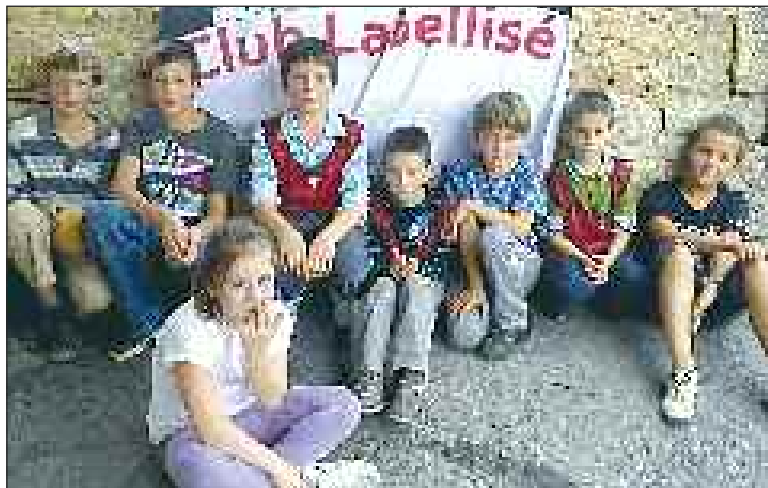
Jeunes et déjà qualifiés